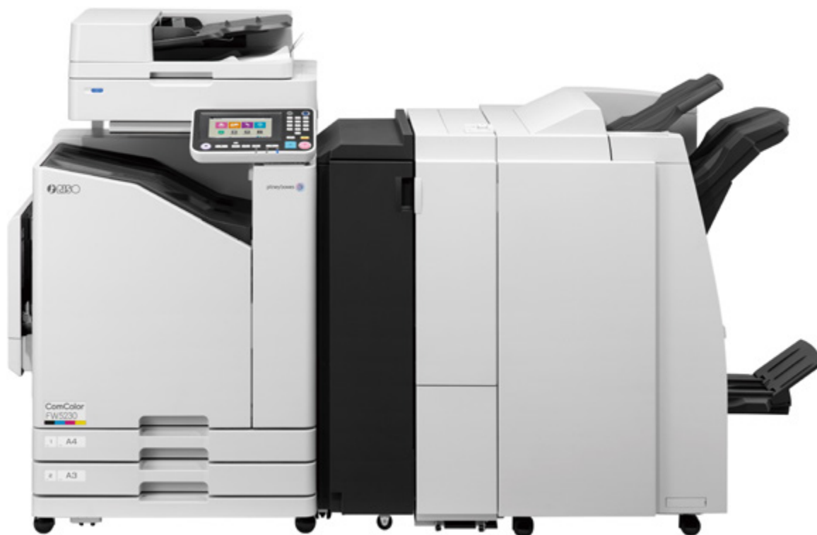
Heften und Lochstanzen