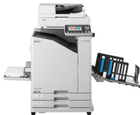
Wide Stacking Tray