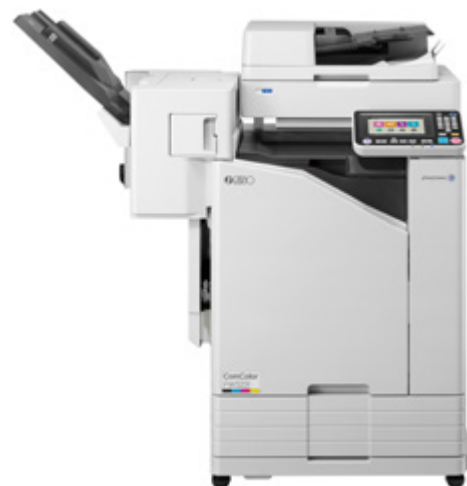
Heften und versetztes Stapeln

Breiteres Papier kann bedruckt und in einem breiteren Ablagefach gestapelt werden, das an die Größe des verwendeten Papiers angepasst wird.